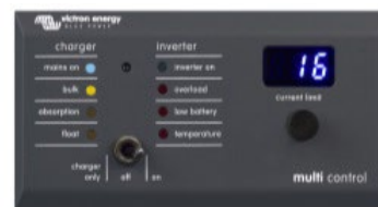
Tableau de commande numérique Multi Control

Afin d'implémenter les fonctions PowerControl et PowerAssist et pour optimiser l'autoconsommation grâce à une sonde de courant externe. Courant maximal : 50 A, 100 A respectivement. Longueur du câble de connexion : 1 m.