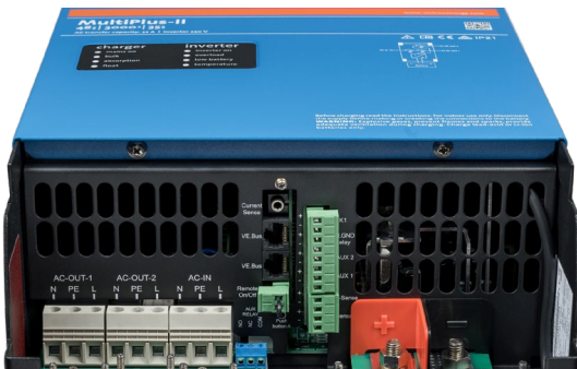
Zone de connexion

Permet de mesurer la tension de batterie et la température et de superviser et contrôler le système avec un Smartphone ou tout autre dispositif équipé de Bluetooth.