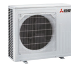
MUZ-FT 35/50 VGHZ